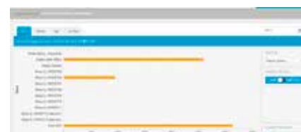
3. Confronto dell'utilizzo di energia tra più sedi