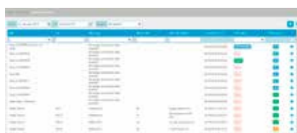
5. Controllo di allarmi e previsioni di guasto