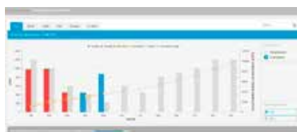
2. Confronto dell'utilizzo di energia con valori target