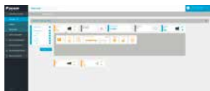
1. Monitoraggio e controllo del sistema