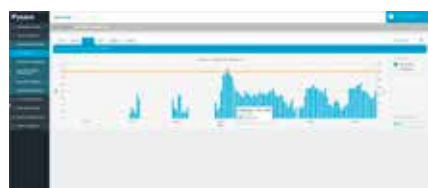
4. Controllo dei consumi energetici dettagliato